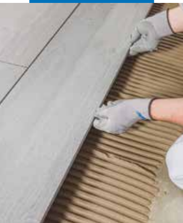
Posa di ceramica effetto legno su supporto impermeabilizzato con Mapelastic