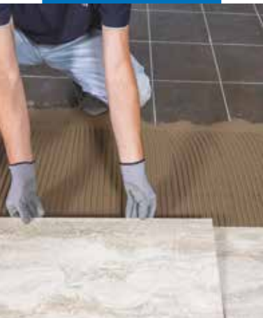
Posa di ceramica effetto pietra in sovrapposizione alla pavimentazione esistente