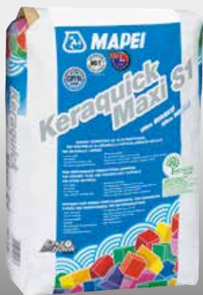
Keraquick Maxi S1 bianco - ultra bianco