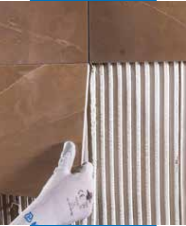
Posa di ceramica a parete