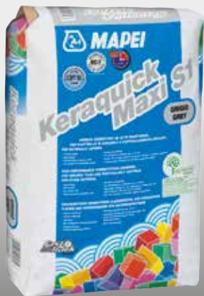
Keraquick Maxi S1 grigio