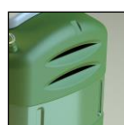
Finestre per areazione

Colori: Verde (RAL simil 6025), Blu (RAL simil 5017), e Grigio (RAL simil 7037) standard; altri colori su richiesta; possibilità di personalizzazione.