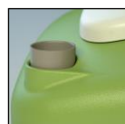
Condotta di sfiato