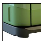
Base rialzata per movimentazione con forche + incavi per trasporto con carrello