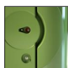
Chiavistello con segnalazione libero/occupato + chiusura con chiave