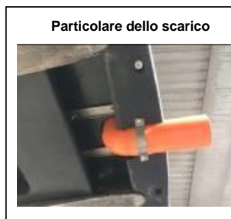
Particolare dello scarico