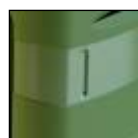
Maniglie laterali e posteriore per facilitare la movimentazione