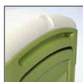
Finestrelle per areazione

Colori: Verde (RAL simil 6025), Blu (RAL simil 5017), e Grigio (RAL simil 7037) standard; altri colori su richiesta; possibilità di personalizzazione.