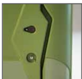
Chiavistello con segnalazione libero/occupato + chiusura con chiave