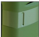
Maniglie laterali e posteriore per facilitare la movimentazione