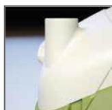
Condotta di sfiato