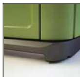
Base rialzata per movimentazione con forche + incavi per trasporto con carrello